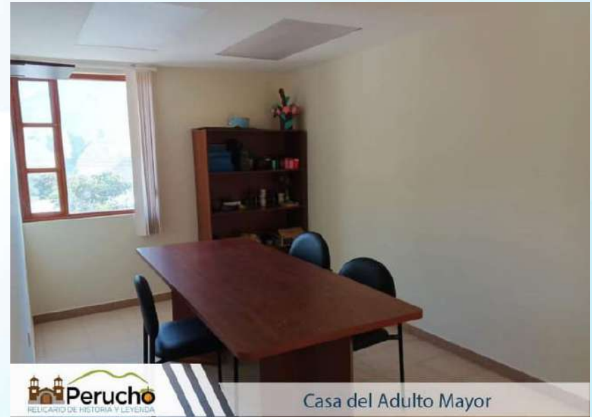
Casa del Adulto Mayor