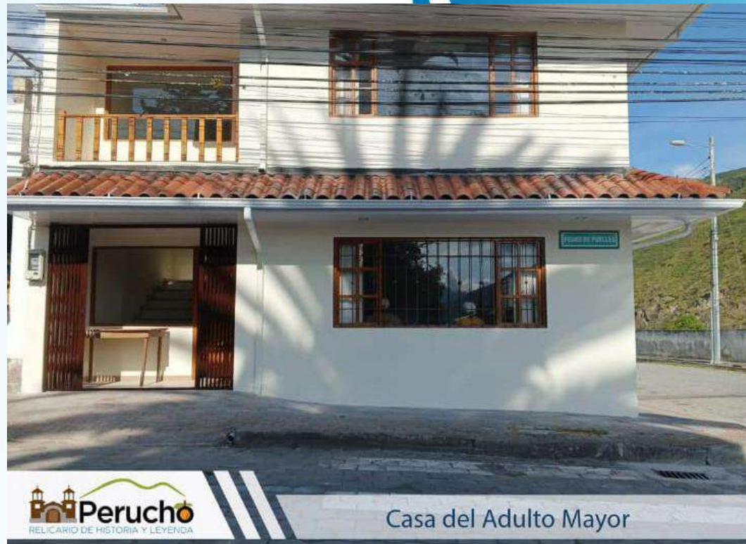
Casa del Adulto Mayor